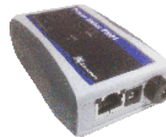
AC Line Voltage Monitor / Web Power Meter - PM01