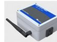
Web Power Meter with Wi- Fi Package - PM21-W