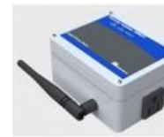
Web Power Meter with add-on Temperature and Humidity Sensors - PM21-H